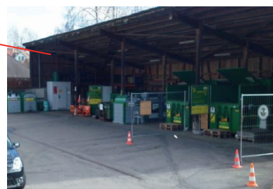
Sammelstelle Stampfi Stampfstrasse 8