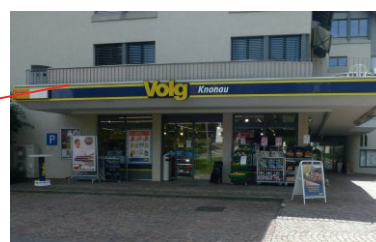
Volg Stampfstrasse 1