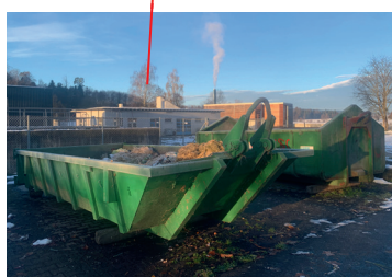
Im Grund 1